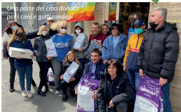
Una parte del cibo donato per i cani e gatti randagi

Grandissimo successo per il 25° compleanno dell'Associazione Animalisti Italiani: 25 anni di lotte per i diritti degli animali. Oltre 250 persone, una sala gremita da ospiti illustri: dalla ballerina Carmen Russo, alla musicista Alessandra Celletti, politici, presidenti e cariche istituzionali di varie associazioni del calibro