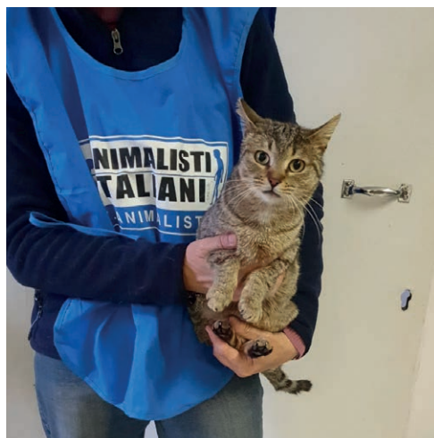
Sterilizzato e pronto per l'adozione