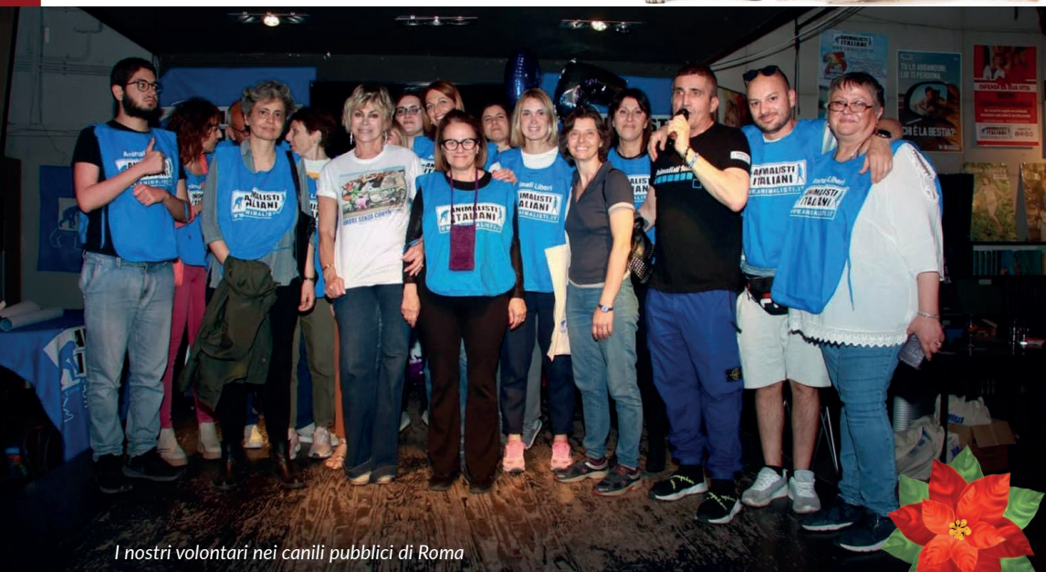
I nostri volontari nei canili pubblici di Roma

Grandissimo successo per il 25° compleanno dell'Associazione Animalisti Italiani: 25 anni di lotte per i diritti degli animali. Oltre 250 persone, una sala gremita da ospiti illustri: dalla ballerina Carmen Russo, alla musicista Alessandra Celletti, politici, presidenti e cariche istituzionali di varie associazioni del calibro