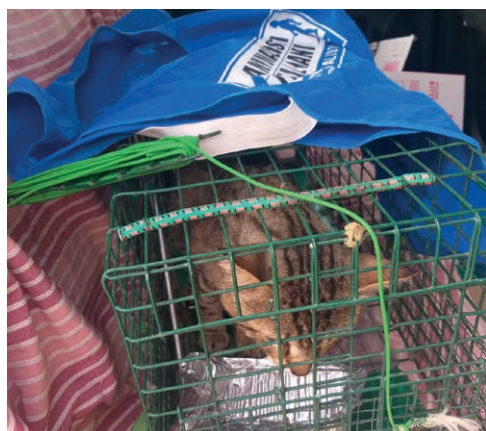
Trasporto dopo il recupero