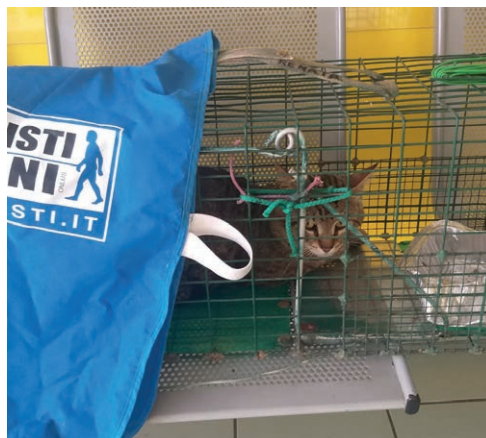
In attesa del veterinario

Invia una mail all'Associazione Animalisti Italiani all'indirizzo roma@animalisti.it oppure contatta la nostra referente al 338 154 5313 . Le sterilizzazioni verranno portate avanti fino all'esaurimento dei fondi stanziati.