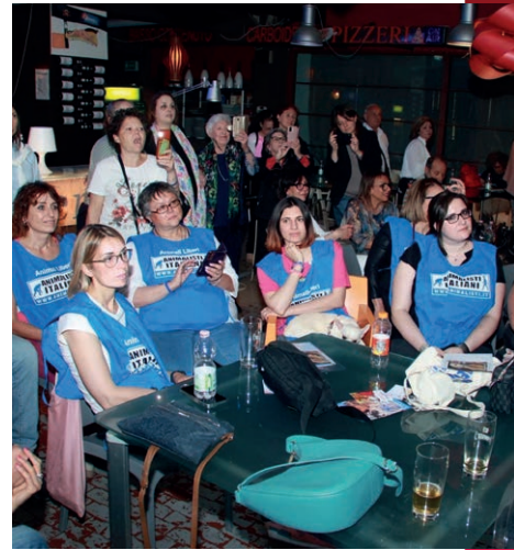
I nostri volontari

maniera capillare attraverso la nostra sede centrale. Inoltre, 5.000€ sono stati donati ai volontari locali per gli animali di Calabria, Campania, Emilia Romagna e Toscana.